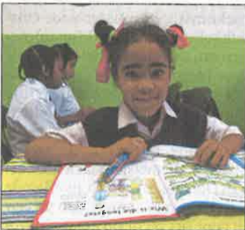
© Born in Africa te ontvangen!

Elk kind dat deel uitmaakt van Born in Africa heeft een peetouder die jaarlijks 300 euro betaalt. Het kind ontvangt jaarlijks een nieuw schooluniform, individuele opvolging, naschoolse huiswerkbegeleiding en extra activiteiten. Elk kind gaat ook op educatieve vakantie-uitstappen en kampen met Born in Africa. Peetouders krijgen dan weer driemaal per jaar een persoonlijke enveloppe, gevuld met tekeningen, foto's, briefjes en rapporten van hun petekind! Bent u bereid zich te engageren en wilt u peetouder worden van een kind in Zuid-Afrika, dat kan! Vul het inschrijvingsformulier in op de website www.borninafrica.org of stuur een mailtje naar info@borninafrica.org om de nodige informatie