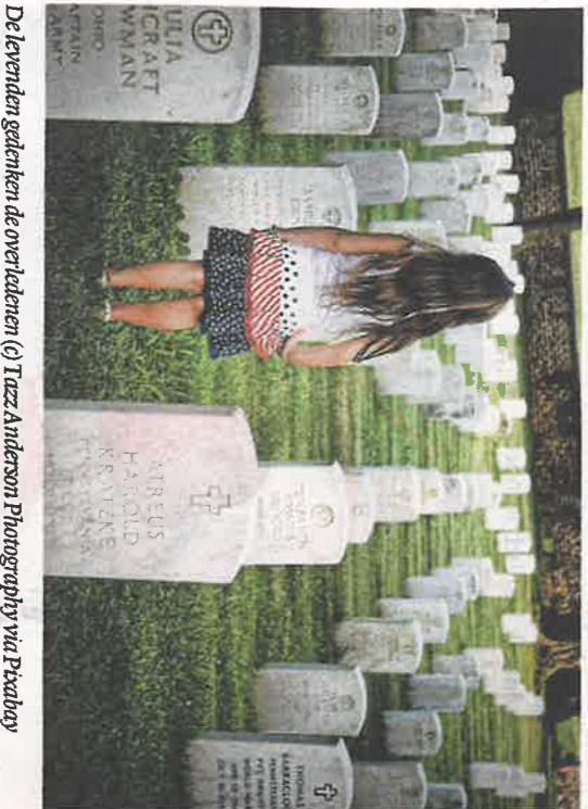
De levenden gedenken de overledenen