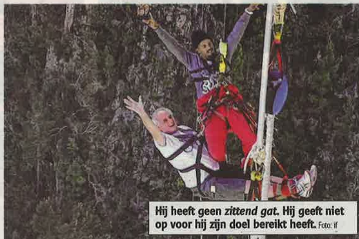
Hij heeft geen zittend gat. Hij geeft niet op voor hij zijn doel bereikt heeft.

'Ik heb persoonlijk meer dan een miljoen euro ingezameld